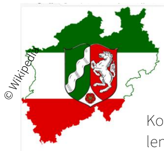
Kommunalwahlen NRW 2025

Wir alle leben in Dörfern oder Städten. Diese nennt man auch Gemeinde oder Kommune. Kommunalpolitik ist also Politik für die Menschen in den Dörfern und Städten.